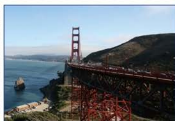
元画像：ゴールデン・ゲート・ブリッジ