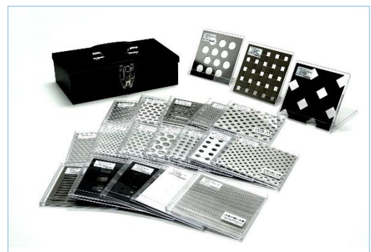
図1. 松陽パンチングメタルサンプルセット2

人気のパターンや配列、カラーを組み合わせたもので、サンプルは1枚ずつプラスチック製透明ケースに収納されており、プレゼンなどの際には図1のように立てて展示をすることが可能です。また、持ち運びに便利なスチール製のボックス入りとなっています。