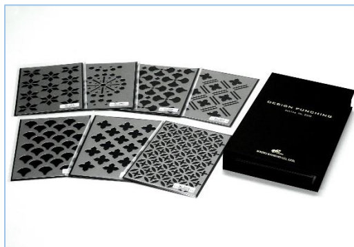
図 2. デザインパンチング サンプルブック

デザインパンチングは、パンチングメタルにファブリックのような模様を付加し、よりゆたかな表現力を実現したものです。これまでパンチングメタルと組み合わせがむずかしかった木材とも調和がとれ、エクステリアのみならずインテリアの空間デザインにも用いることができます。