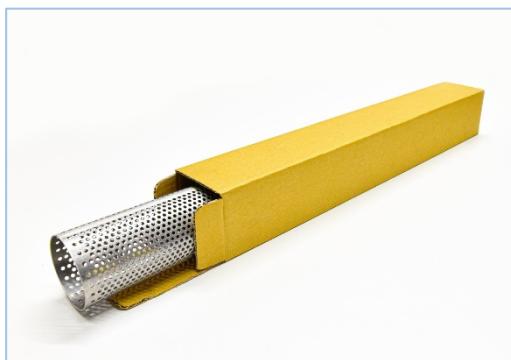
写真3. 梱包例 (参考:1本セット)