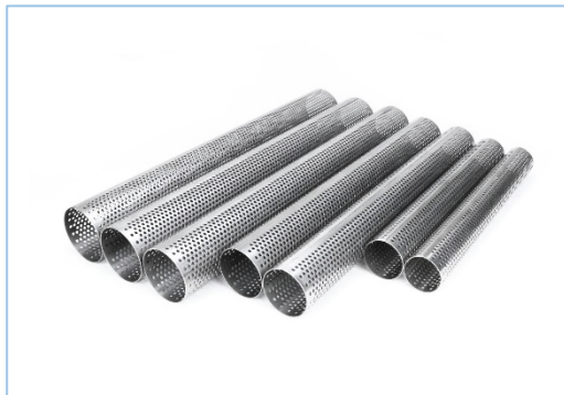
写真1. パンチングパイプ例

https://punching-shop.com/products/list.php?ln=100&cat=37