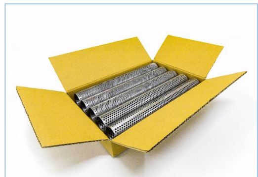
写真4. 梱包例 (参考:5本セット)